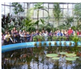
Momente din timpul excursiei cu clasa I A.

"Implicarea elevilor în acest gen de activități extracurriculare contribuie la dezvoltarea personalității elevilor, la formarea unor competențe necesare unei bune dezvoltări pentru o integrare armonioasă în societate."