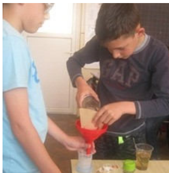
Momentul derulării experimentelor științifice cu clasa a IV-a E

„La finalul zilei, elevii clasei a-IV-a E s-au dovedit familiarizați cu modul de organizare a unor activități la nivel gimnazial; și-au fixat și îmbogățit cunoștințele teoretice.”