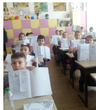
Elevi din clasa a IV-a D la aniversarea poetului Mihai Eminescu.