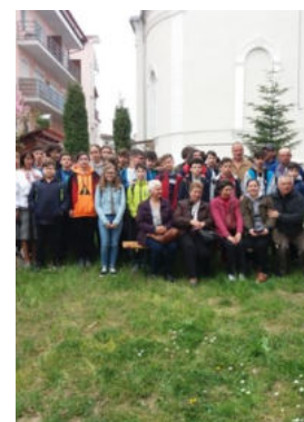
Grupul de elevi implicați în acțiunea socială.

"Scopul întâlnirii a fost tocmai dorința cadrelor didactice de a le arăta elevilor diferite situații de viață, dar mai ales de a afla că aceste persoane își doresc să fie tratate cu respect în societate."