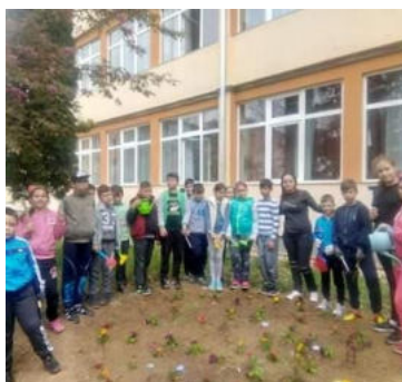
Muncitorii harnici din clasa a III-a B.

„Fără a nega importanța educației de tip curricular, devine tot mai evident faptul că educația extracurriculară, adică cea realizată dincolo de procesul de învățământ, își are rolul și locul bine stabilit în formarea personalității tinerilor.”