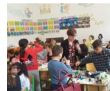
Parteneriatul între elevii clasei a II-a D din școala noastră și elevii de la Colegiul Național George Barițiu din Cluj-Napoca