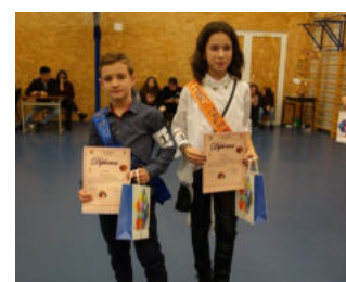
Perechi câștigătoare la concursul Miss și Mister Bobocel.