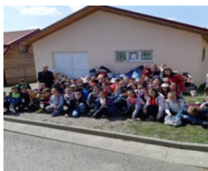
Echipa micilor voluntari cu suflete mari!

”Putem spune că în urma acestei acțiuni, elevii au învățat să aprecieze lucrurile pe care le au.”