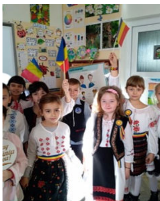
Elevii clasei I B în timpul programului artistic "Drag de România mea"

"Generațiile de astăzi trebuie să învețe de la noi, cum se cinstește memoria înaintașilor și cum aceștia au făurit cu prețul jertfei omenești, existența țării. ."