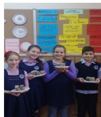
Secvențe cu miciii grădinari din clasa a IV-a B

”Mica mea Grădină nu reprezintă numai o modalitate de a cultiva fructe, legume și plante aromatice, ea este un instrument puternic de învățare prin activități reale.”