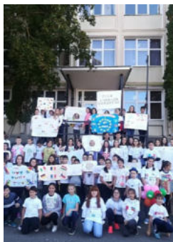
Ziua Europeană a Limbilor organizată la Școala Gimnazială "Avram Iancu".

"Catedra de limbi moderne a Școlii Gimnaziale „Avram Iancu” a ales să cultive plurilingvismul, dar și potențialul diversității culturale a Europei.”