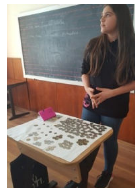
Una din colecțiile elevilor din clasa a VI-a A

Importanța acestei activități constă în dezvoltarea la elevi: a abilităților de comunicare, de organizare unei prezentări, de a-și stăpâni emoțiile la susținerea unui conținut în public, de a valoriza cotidianul și pasiunile lor, de a se obișnui cu aprecierea critică a celorlalți.