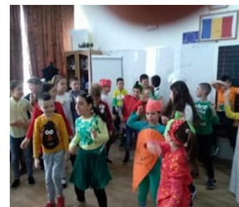
Elevii clasei a II-a B costumați pentru sceneta „O întâmplare sănătoasă”.