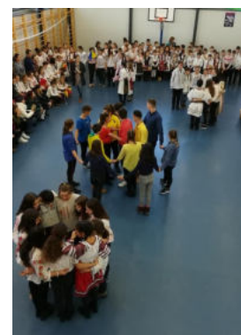
Spectacolul aniversar "România 100"