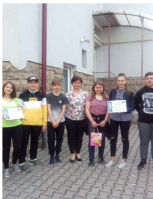
Echipajul Școlii Gimnaziale "Avram Iancu" participant la concursul de electronica.