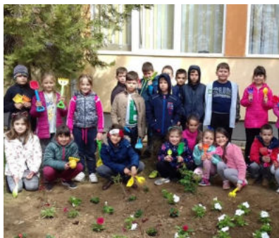
Grupul de elevi ai clasei I C la activitatea de ecologizare a grădinii școlii.

„Fără a nega importanța educației de tip curricular, devine tot mai evident faptul că educația extracurriculară, adică cea realizată dincolo de procesul de învățământ, își are rolul și locul bine stabilit în formarea personalității tinerilor.”