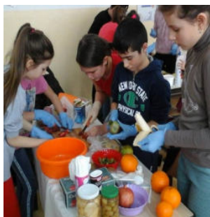
Clasa a IV-a A în timpul preparării salatei de fructe.

”Ca învățător, am selectat activități care să valorifice pasiunea copiilor pentru activitatea sportivă, pentru mișcare și competiție.”