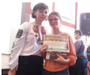
Momentul premierii la Etapa Națională a Concursului transdisciplinar "Ionel Teodoreanu"