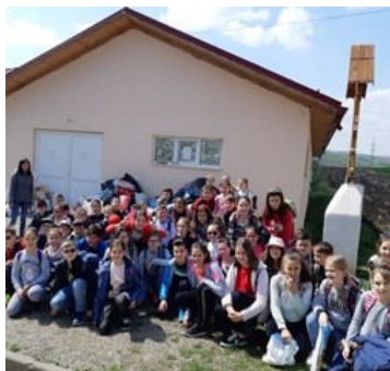
Grupul micilor voluntari din clasa a III-a E și a IV-a C

”Putem spune că în urma acestei acțiuni, elevii au învățat să aprecieze lucrurile pe care le au.”