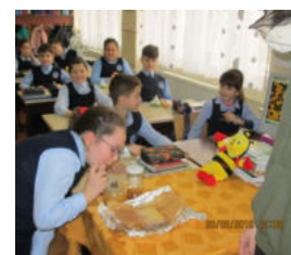
Elevii clasei a III-a D învățând despre beneficiile consumului de miere.

Concurs școlar de activități educative menite să încurajeze consumul de alimente sănătoase și să conștientizeze populația școlară atât asupra beneficiilor consumului de fructe și legume cât și asupra efectelor nocive ale alimentelor de tip fast-food.