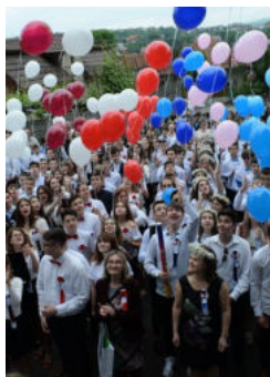
Momentul absolvirii clasei a opta, promoția 2019.

La limba română patru elevi au avut nota 10 la evaluarea națională, iar la matematică șase elevi au obținut nota 10.