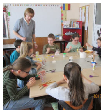
Momente din timpul activității „Micii decoratori” cu clasa a III-a D.

”Activitatea a contribuit la consolidarea relației dintre școală și familie și la creșterea respectului pentru muncă în rândul elevilor participanți.”