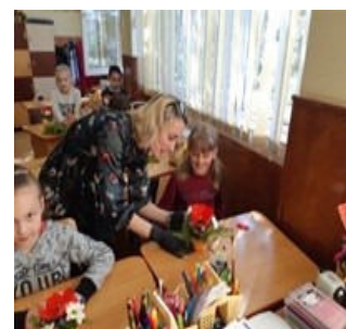
Imagini din timpul realizării aranjamentelor florale.

O simplă fotografie nu poate reda pe deplin bucuria care vine din reușita muncii proprii la un elev de clasa a II-a, dar cu siguranță sufletele de copil care au vibrat la așezarea florilor în glastre, vor păstra pentru totdeauna sentimente luminoase trăite în săli de clasă