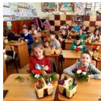
Aranjamente florale realizate cu tehnica "pave" de elevii clasei a II-a C.

O simplă fotografie nu poate reda pe deplin bucuria care vine din reușita muncii proprii la un elev de clasa a II-a, dar cu siguranță sufletele de copil care au vibrat la așezarea florilor în glastre, vor păstra pentru totdeauna sentimente luminoase trăite în săli de clasă