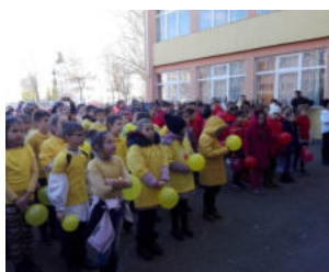
Aniversarea a 100 de ani de la Marea Unire în corpul B al școlii.

"Generațiile de astăzi trebuie să învețe de la noi, cum se cinstește memoria înaintașilor și cum aceștia au făurit cu prețul jertfei omenești, existența țării. ."