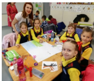
Echipajul "Albinuțele harnice" pregătind materialele pentru concurs.