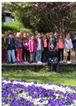
Grupul de elevi al clasei I A în excursie la Grădina Botanică "Alexandru Borza"

"Implicarea elevilor în acest gen de activități extracurriculare contribuie la dezvoltarea personalității elevilor, la formarea unor competențe necesare unei bune dezvoltări pentru o integrare armonioasă în societate."