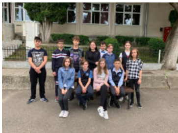
Grupul de elevi ai școlii noastre premiați la Concursul "English Adventures"

"O noutate în acest an a fost posibilitatea elevilor din clasa a IV-a de a participa, indirect la acest concurs."