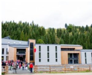
Baza de pregătire a Cru- cii Roșii de la Valea Ierii, județul Cluj.

Crucea Roșie Română este o organizație al cărei existență se îmbină cu existența istorică a României ca stat.