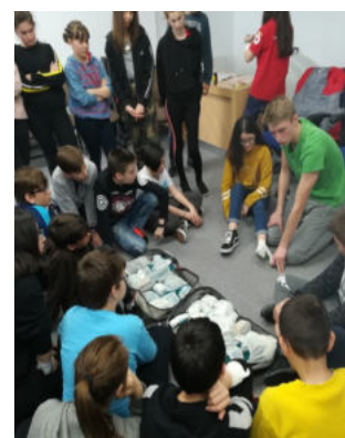
Grupul de elevi învățând să intervină la o luxație.