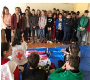
Săptămâna "Școala Alt-fel", elevii demonstrând tehnici de prim ajutor.