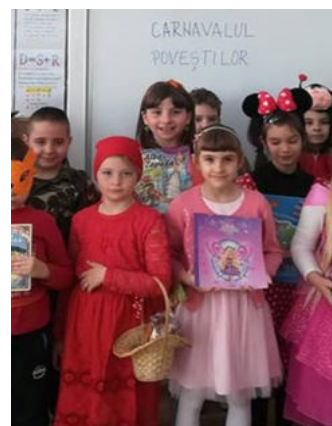
Câteva personaje de la Carnavalul Poveștilor .

„Activitatea Carnavalul poveștilor a cuprins mai multe componente: alegerea unei povești pe care să o citească, alegerea unui personaj din acea poveste, crearea unui costum potrivit și prezentarea în fața colegilor a cărții, a poveștii, a respectiv personajului ales.”