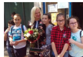
Momente de la finalul activității.

”Este de remarcant faptul că în acest an, școala noastră a participat cu un total de 50 de elevi la acest festival. La ciclul primar 20 de elevi, iar la cel gimnazial cu 30 de elevi distribuiți în cele două piese prezentate.”