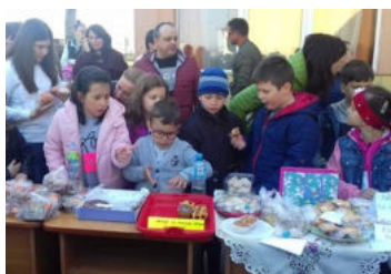
Produce naturale la "Târgul de pâine"

Anul acesta, fiind elevă în clasa a VI - a am avut plăcerea de a participa din nou la Târgul de pâine organizat de colectivul Școlii Gimnaziale „Avram Iancu”, Dej. Produse făcute cu drag de elevii școlii și părinții acestora, au fost vândute într-un timp foarte scurt, ceea ce denotă că au fost foarte gustoase. De la