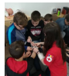
Moment de învățare în Tabăra de prim ajutor a Crucii Roșii din România

"Elevi și-au consolidat cunoștințele de intervenții în situații de urgență, au deprins metode de implicare în probleme sociale corelate cu acțiunile de prim ajutor și au simulat un exercițiu de alarmare și acțiune la un apel de urgență pentru un grup de răniți."