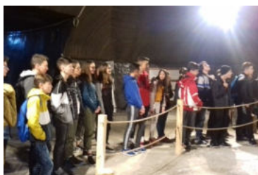
Grupul de elevi al clasei a VI-a B în vizită la Salina Turda.