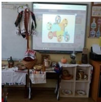
Expoziția organizată în sala de clasă a clasei a IV-a D prilejuită de activitatea didactică.

Elevul își află identitatea, își formează sentimentul de apartenență la locul natal, cunoscând personalitățile, datinile, obiceiurile din zona natală mai ales, dar și cele specifice țării de baștină.