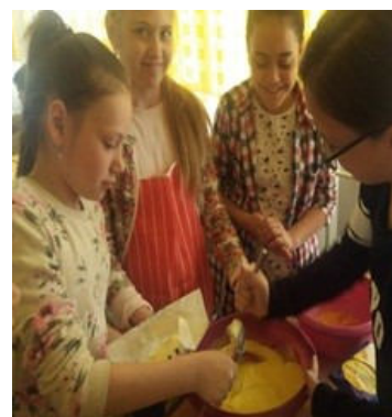
Elevii clasei a III-a A cooperând pentru activitățile educative.

Activitățile extracurriculare formează comportamente sănătoase, constituie sursă de interacțiune între elevi, contribuie la dezvoltarea capacității de dialog și cooperare, presupun cultivarea respectului față de sine și față de ceilalți.