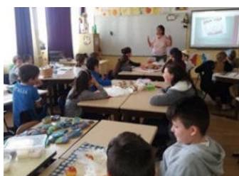
Momente din timpul activității organizate cu clasa a IV-a D

Elevul își află identitatea, își formează sentimentul de apartenență la locul natal, cunoscând personalitățile, datinile, obiceiurile din zona natală mai ales, dar și cele specifice țării de baștină.