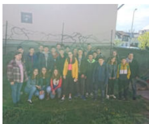
Grupul de elevi al clasei a VII-a B în timpul vizitei la Casa Speranței, As. Ramsau

Miercuri, 17 aprilie 2019, în cadrul activităților dedicate „Școlii Altfel”, copiii de la Casa Speranța, Asociația Ramsau, Dej au fost vizitați de elevii clasei a VII-a B, de la Școala Gimnazială „Avram Iancu” din Dej.