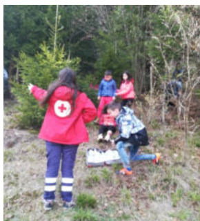
Momentul intervenției din pădure.

”Fără să ne dăm seama cum, am descoperit că suntem oboșiți. Pe fețele tuturor se citea satisfacția muncii cu rost.”