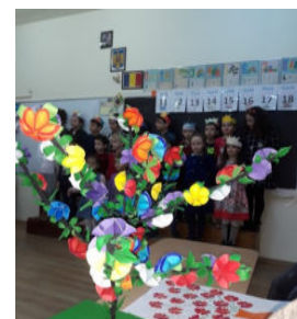
Obiecte decorative făcute de micii elevi cu părinții lor.