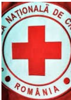
Sigla organizației Crucii Roșii.

Crucea Roșie Română este o organizație al cărei existență se îmbină cu existența istorică a României ca stat.