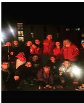
Elevii și voluntarii în timpul focului de tabără.

Distinctiv pentru activitatea lui era atributul de a fi omniprezent, ca un fel de constantă de prin formulele de fizică.